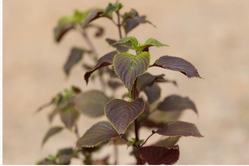
紫蘇 四氣:温 五味:辛 藥用部份:葉