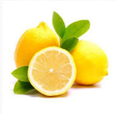
檸檬 四氣:平 五味:甘、酸 藥用部份:果實