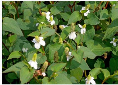
魚腥草 四氣:微寒 五味:辛 藥用部份:全草