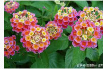
馬纓丹 四氣:溫 五味:苦、微甘 藥用部份:葉、根、花