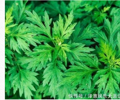
艾葉 四氣:温 五味:辛、苦 藥用部份:葉