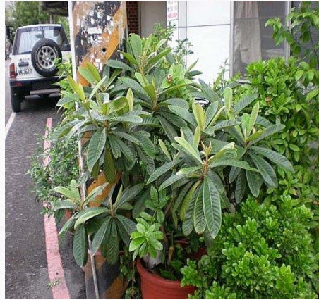
枇杷 四氣:涼 五味:甘、酸 藥用部份:果實、葉