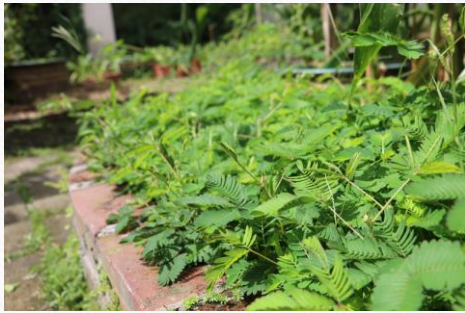
含羞草 四氣:涼 五味:甘、澀 藥用部份:葉