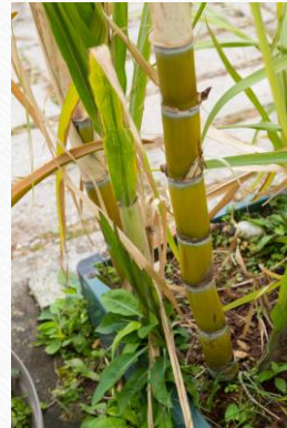
黃皮甘蔗 四氣:涼 五味:甘 藥用部份:葉