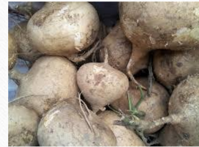
沙葛 四氣:涼 五味:甘 藥用部份:根