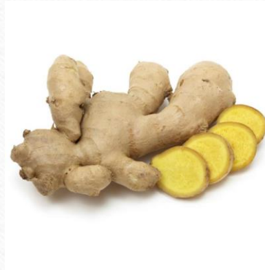
薑 四氣:温 五味:辛 藥用部份:根